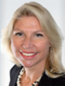
RA Mag. ECKEL LL.M.